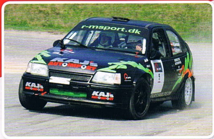
Rasmus Sørensen måtte kaste håndklædet i ringen i 3. heat.

var klar fra første start. Først skulle der køres to heat den ene vej rundt og efter pausen skulle banen vendes til de sidste to heat.