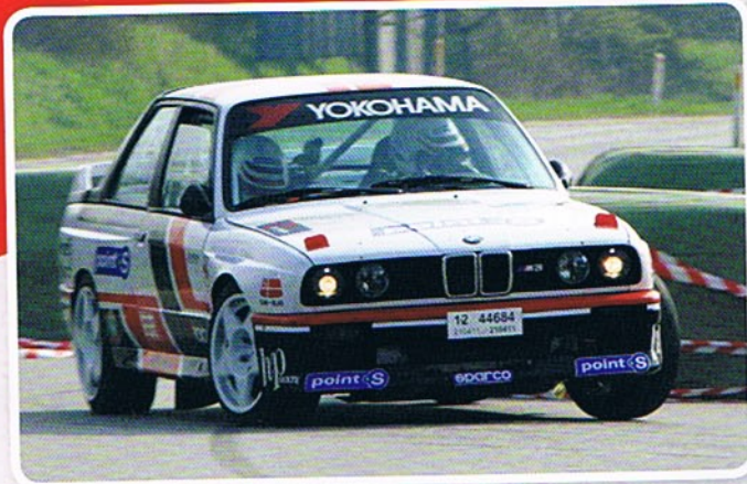
Den hurtige BMW kom for tæt på en chikane og mistede et hjul.