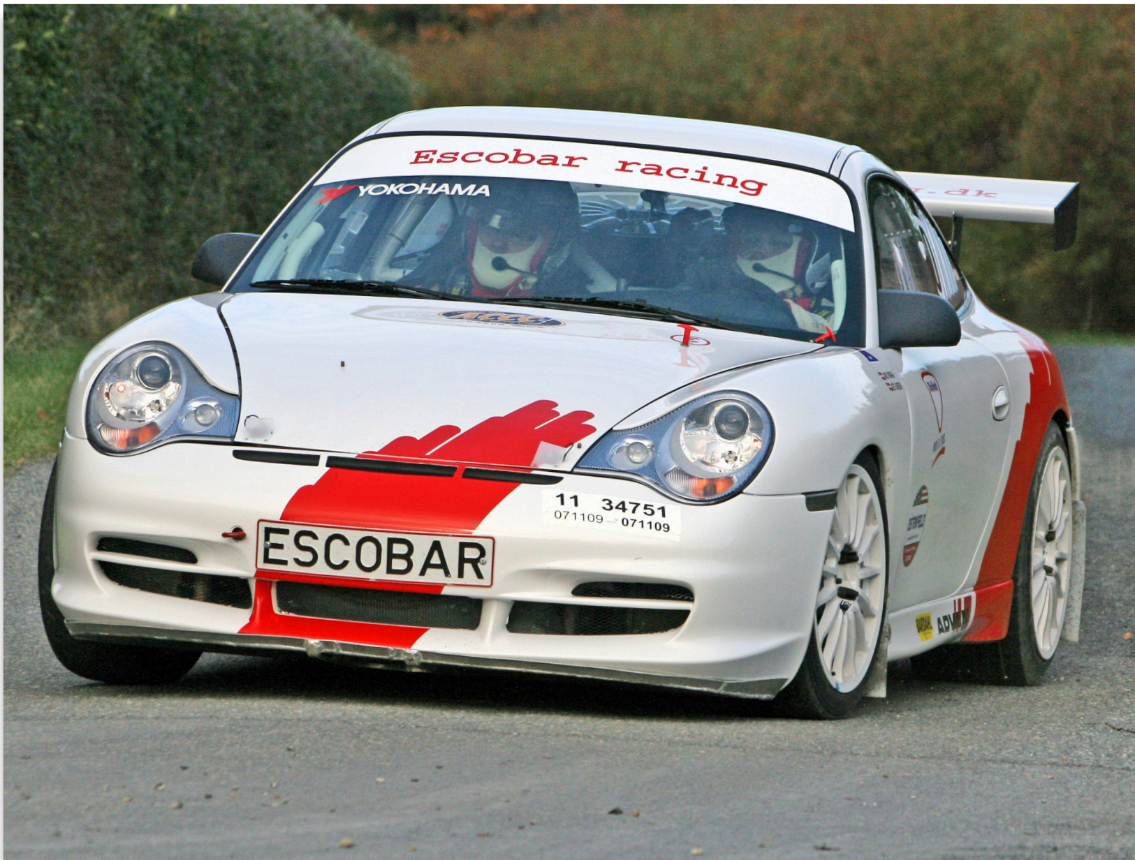
Ved Mini Rally ved Slagelse, foto: Brian Juel