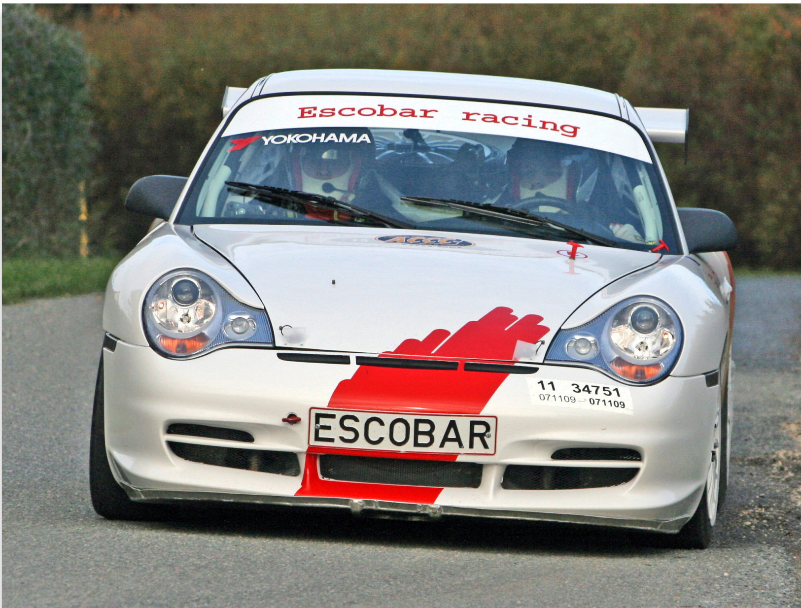
Porschen i action ved Slagelse