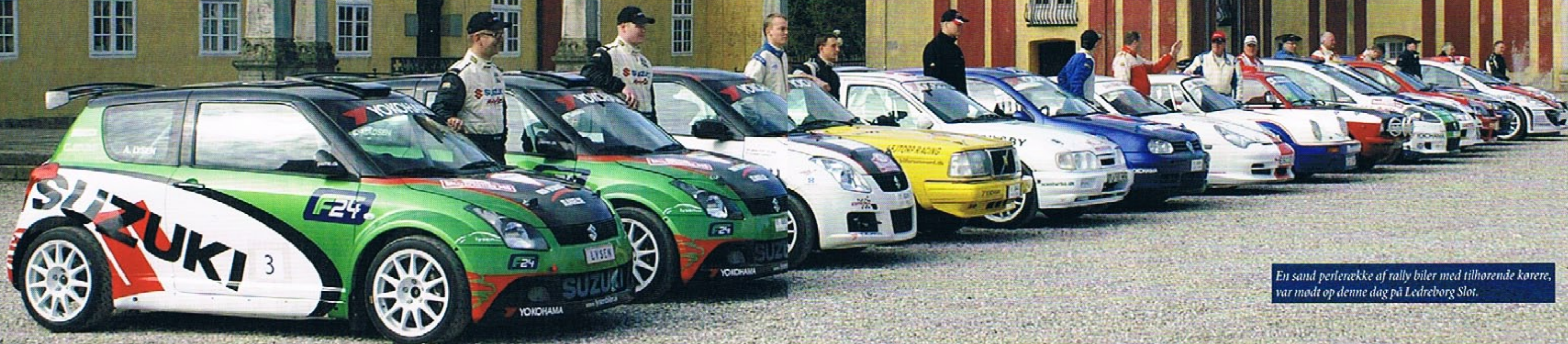
En sand perlerække af rally biler med tilhørende kørere, var mødt op denne dag på Ledreborg Slot.