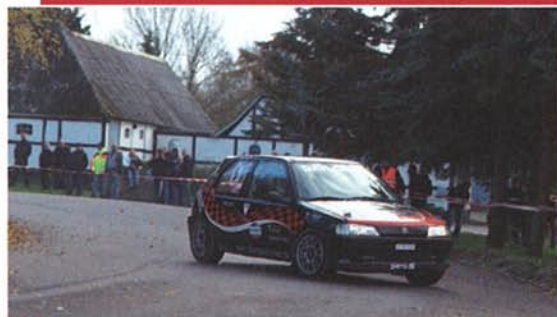
En lille hurtig bil, Peugeot 106 EVO, med Benny Pedersen ved rattet.